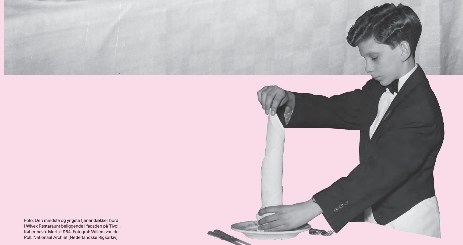
Foto: Den mindste og yngste tjener dækker bord i Wivex Restaraunt beliggende i facaden på Tivoli, København. Marts 1954.